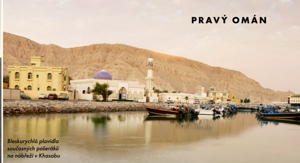
Bleskurychlá plavidla současných pašeráků na nábřeží v Khasabu

Sankce, které Spojené státy uvalily na Írán, zde způsobily nedostatečné zásobení přístrojů do domácnosti, takže pašeráci si to šinou přes Hormuzský průliv až do Musandamu, kde nakupují bílou techniku, a pak ji vozí zpátky do islámské republiky. Cestou se ovšem musí vyhnout obrovským tankerům a íránské pobřežní stráž. Viděl jsem, ➔