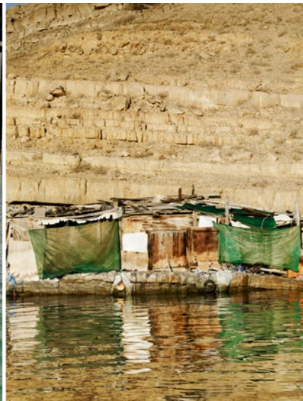
Pevnost postavili v 17. století Portugalci, aby chránila přístav Khasab. Zchátralé domy rybářů (NAHORE VPRAVO) lemují pobřeží poloostrova Musandam a plavci si užívají jeho čisté vody (NAHORE VLEVO)